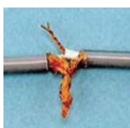
同軸ケーブルの 手ひねり接続